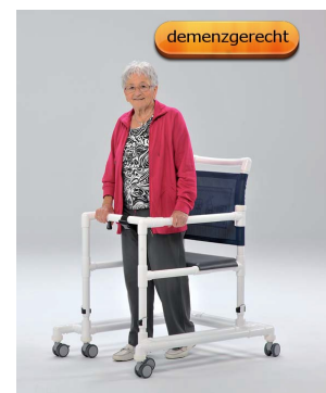
hier in Dunkelblau*